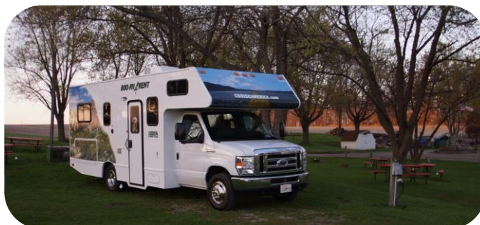
Morgenstund på Sleepy Hollow

Det var en meget koldt nat, og vi vågnede begge to og måtte finde de ekstra tæpper, vi havde taget med hjemmefra. Vi stod op klokken 6:30, og tændte straks for varmen i vognen, idet der kun var 5 graders varme indendørs. Der var lidt rim på græsset hist og pist. Solen var stået op, og gæssene