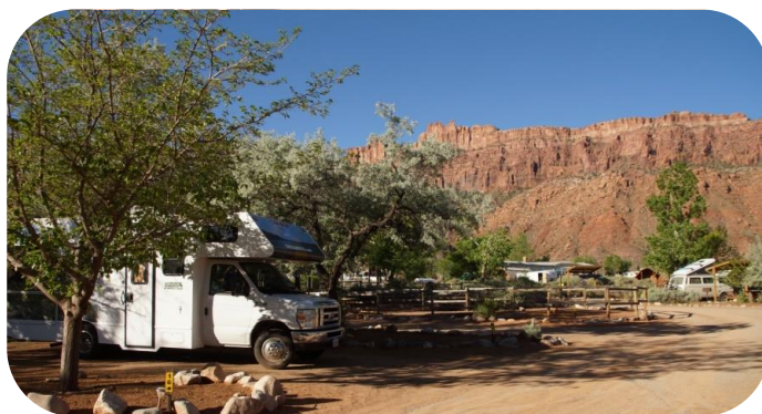
Morgenidyl på KOA, Noab, Utah.

Vi stod op lidt før kl. 7, der var 15 grader i bilen, så vi har ikke frosset i nat. I bjergene omkring os var der dog faldet lidt sne. Vi spiste morgenmad og kørte fra den dejlige KOA plads kl. kvart over otte. Første stop var for bilens skyld, endnu en gang fik den for 100 dollar benzin. Derefter kørte vi direkte til Arches Nationalpark for at fortsætte, hvor vi slap i går. Vi begyndte med doublearch, vi skulle gå en halv kilometer fra parkeringspladsen dertil. Stien var ved at blive forbedret, formentlig fordi at den har været skyllet væk af regn. En flok arbejdere var i gang med at lave et stengærde. Vi kom helt ind i doublearch, en kæmpe opsætning med to sammenhængende buer, vel omkring 20 meters højde.