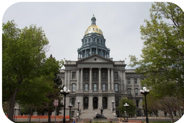
Capitol bygningen i Denver