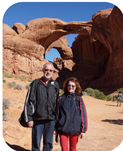
Double Arch og Landscape Arch. Arches Nationalpark, Utah.