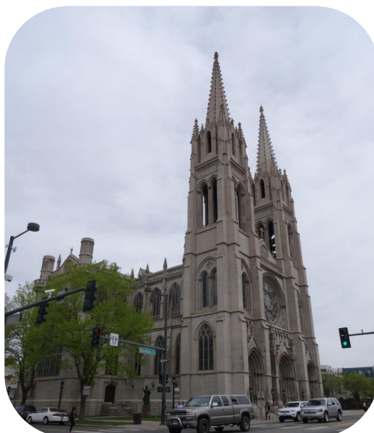
Den smukke katedral i Denver