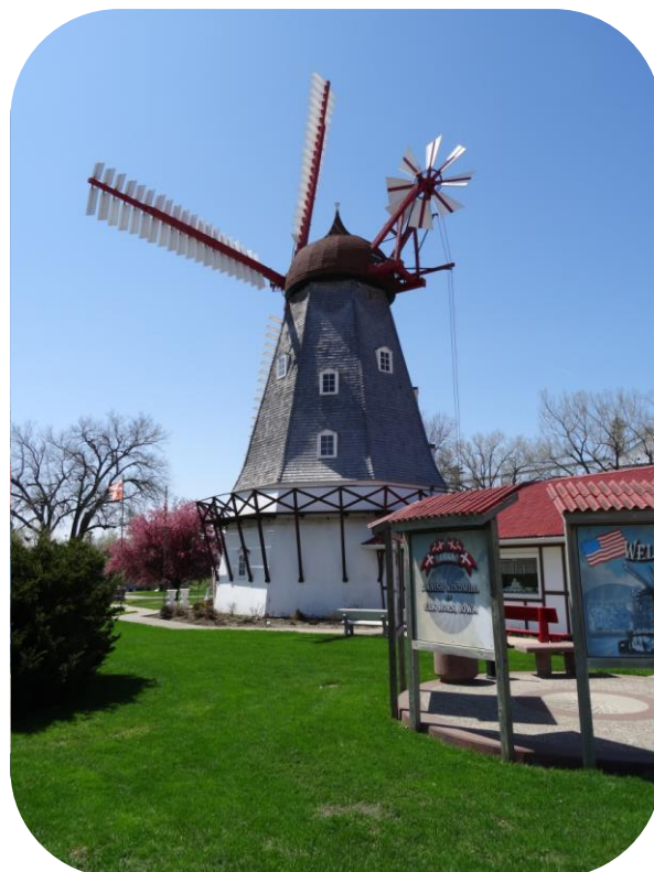
Nørre Snede vindmøllen i Elk Horn

Vi spiste frokost i camperen og forlod derefter byen kl. 15:15. Lige før grænsen til Nebraska lavede vi et kort fotostop, et skilt med scenic view lokkede os fra vejen. Udsigten var fra et højt tårn, vi kunne se langt omkring og fik da i tilgift frisk luft og strakt benene. Vi fortsatte til Mormon Toll Bridge som forbinder Iowa med Nebraska over Missouri River. Broen er fra 1952 og var en toll bridge (betalings bro) frem til 1979, hvor den anden bro lige ved siden af blev åbnet. Mormon navnet kommer af at mormonerne i sin tid havde en handelsrute her. Vi kørte ind i Omaha straks vi var kommet over broen, og fandt det gamle toll house, som i sin tid stod ude midt på broen indtil 1979. Vi forsøgte også at køre helt ned til floden, jeg må have set lidt rådvild ud, jeg holdt lidt for længe stille ved fuldt stop skiltet. En forbi passerende rullede vinduet ned og råbte et eller andet lige som jeg satte i gang. Kort efter holdt jeg stille (parkeret under broen). Ham, der havde råbt efter mig, kom hen og holdt foran os, steg ud af bilen og gik hen til os og spurgte, om vi kunne bruge en vejviser, så var han da frisk på at hjælpe. Han grinede, da jeg fortalte, at det jo blot var for at