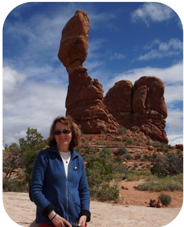
Balanced Rock, Arches NP.

Da vi kom til Arches National Park, valgte vi at købe et årskort til alle national parker for 80 $. Vi startede med at gå ind i Visitor Center, hvor vi købte en bog om 4 National parker og en pjece om blomster fra Utah. Turen ind i den utroligt smukke National Park slyngede sig i hårnåle-sving mellem flotte røde klipper og mange muligheder for fotostop undervejs. Fra den røde jord rejste der sig nogle imponerende stejle klippeformationer, nogle ligger spredt, mens andre står som imponerende enkelt stående kunstværker. Det har nok taget ca. 100 millioner år at skabe de kunstneriske værker ved erosion. Klipperne eroderer ved, at der trænger vand ind i sprækkerne, som derpå springer i frostvejr. Farvespillet var imponerende smukt fra røde nuancer over i beige og videre over i de grønne nuancer. Vi kom forbi Courtyard Towers, de tre sladrehanke, forstenede sandklitter og den balancerende klippe. Vi travede ud til Delicate Arch, en travetur på ca. 3 km hver vej og så gik det meget op ad dertil. Det tog lang tid at gå derud, og vi blev lidt forpustede, men det var et imponerende syn, der mødte os, da vi kom rundt om det sidste hjørne.