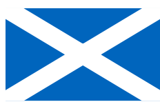
Skt. Andreaskorset (Skotlands flag)