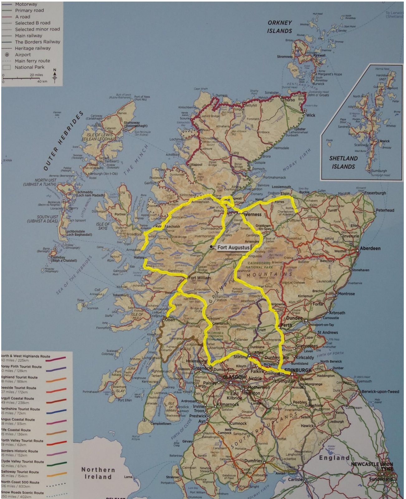
Vores rute er tegnet ind med gult.