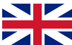
Union Jack, 1606