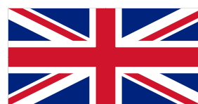
Union Jack siden 1801