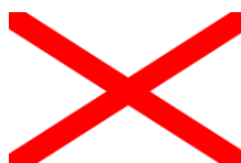
Skt. Patrickskorset (Irlands flag)