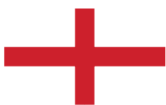
Skt. Georgskorset (Englands flag)