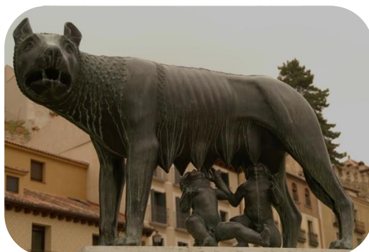
Remus & Romulus (Segovia)